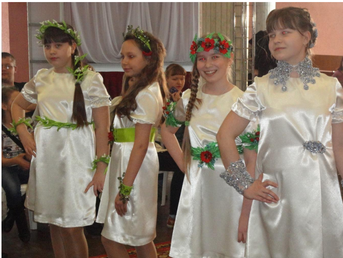
Работа: «Бирюзовая фантазия»