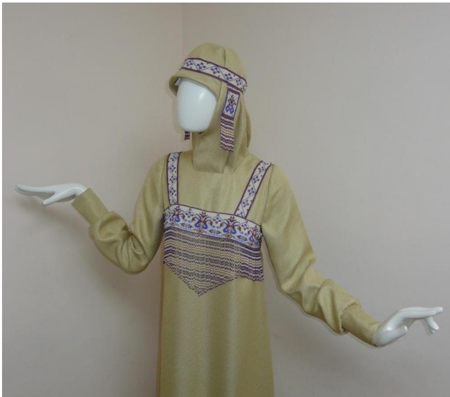
Работа: «Русский сарафан»