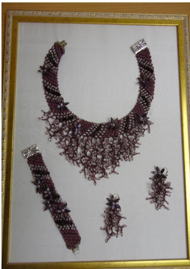
Работа: «Гранатовая россыпь»