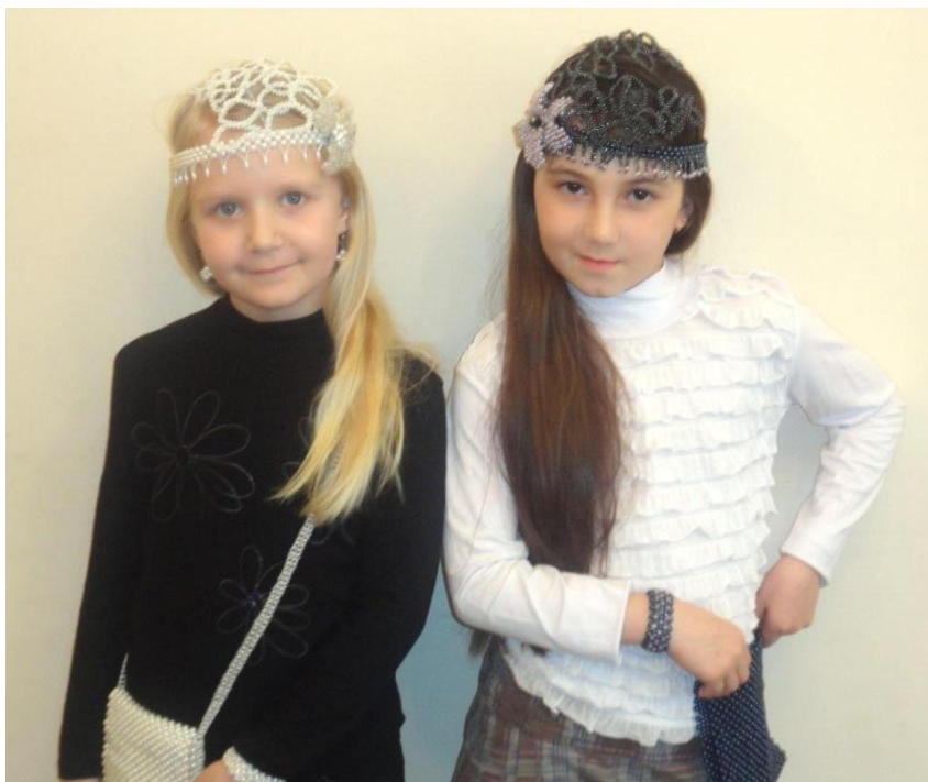
Работа: «День и ночь»