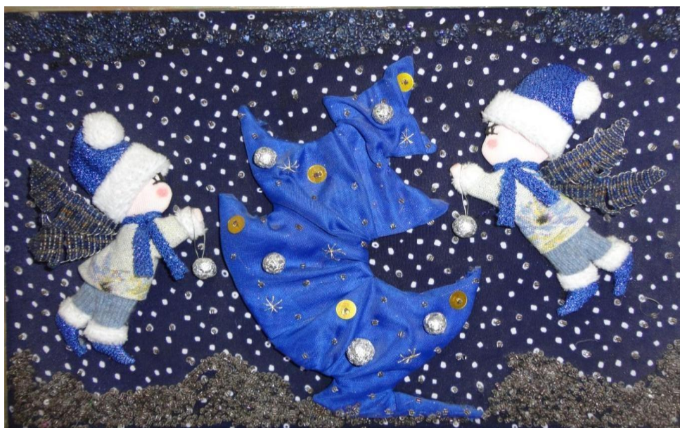
Работа: «Сказочная ночь»