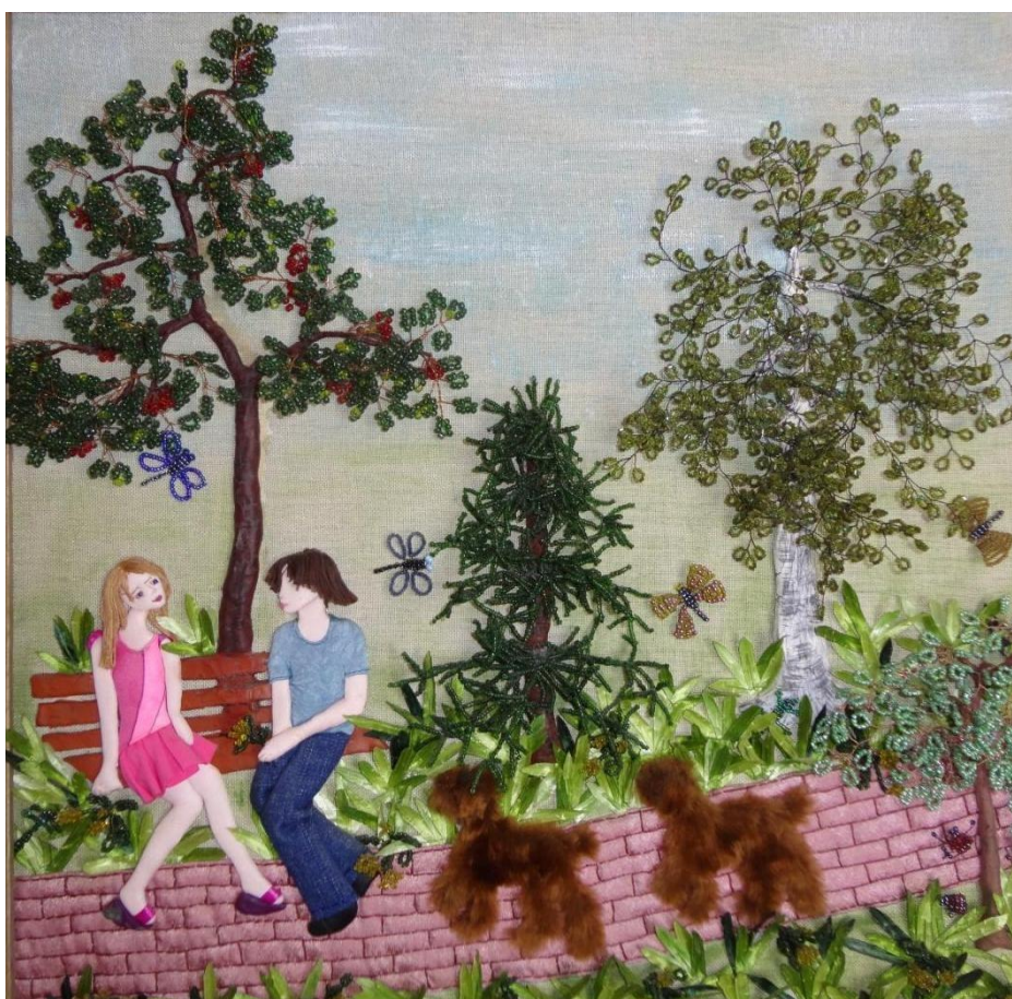
Работа: «Сквер Калининского района»