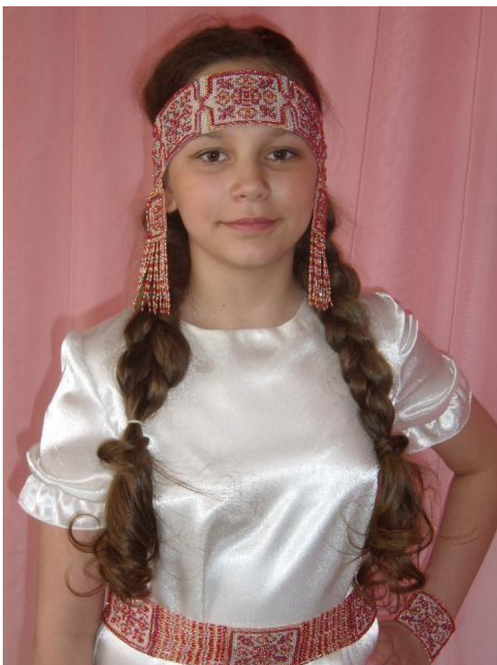
Работа: «Русский узор»