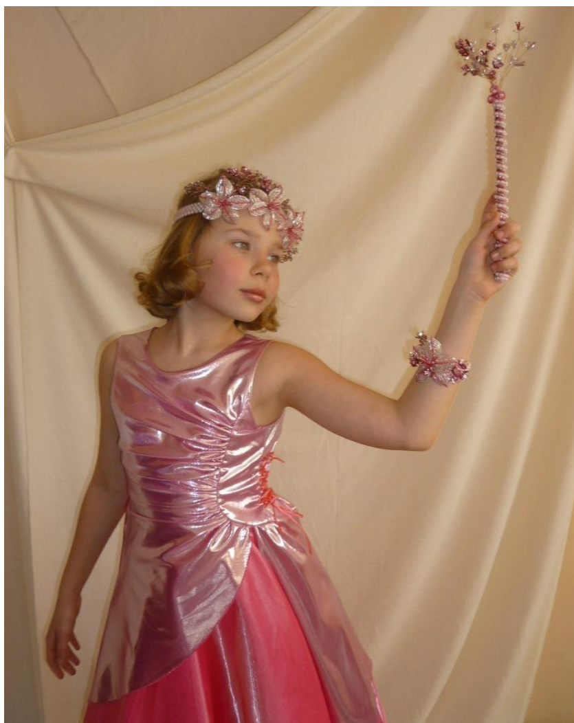
Работа: «Розовая фея»