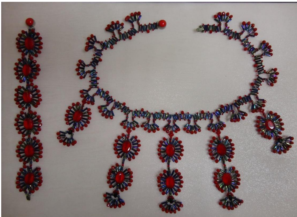
Работа: «Модный красный»