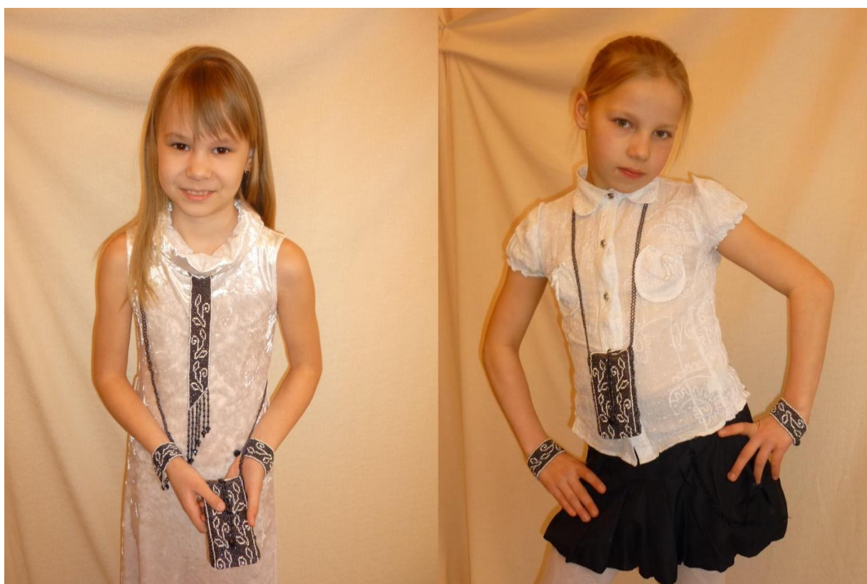
Работа: «Аксессуары для делового и праздничного костюма»