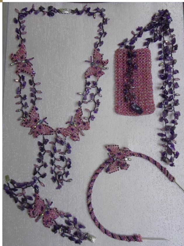
Работа: «Шелест крыльев бабочек»