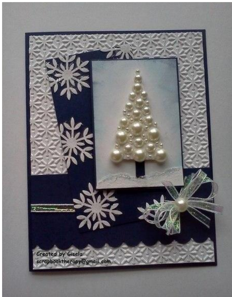
Работа: «Новогодняя открытка»