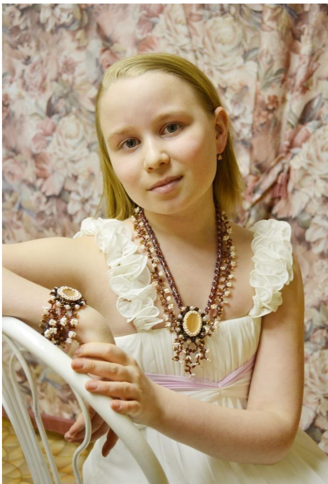
Работа: «Коралловая фантазия»